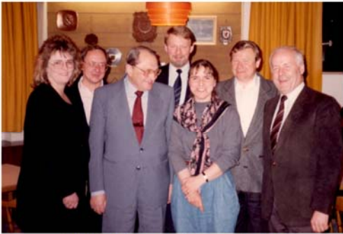
1990 - Die erste Vorstandschaft