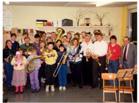
1990 - Erstes Gruppenfoto