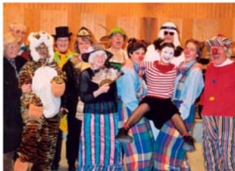
2004 - Faschingsprobeabend