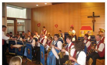
2009 - Muttertagsserenade