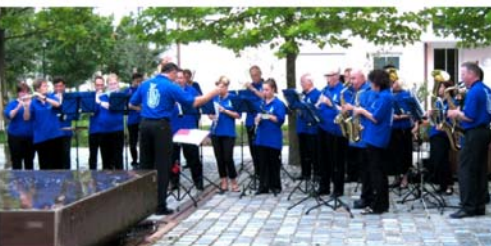
2007 - Brunnenserenade