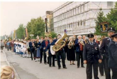
1993 - Feuerwehrjubiläum (Vereinstracht!)