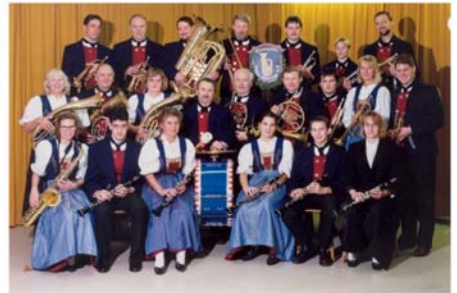
1999 - 10jährige Blaskapelle