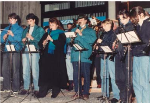
1991- 1. Auftritt im Christkindlmarkt