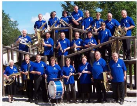
2005 - Bei der 825Jahr-Feier von Ufg.