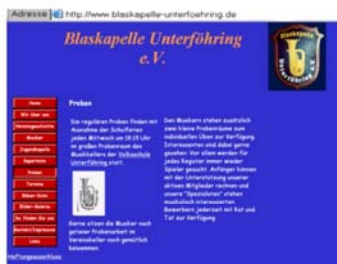
2009 - Unsere Homepage