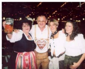
2006 - Auf der Wies'n