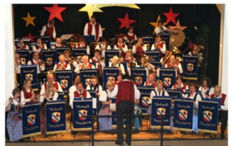
2009 - Neujahrskonzert