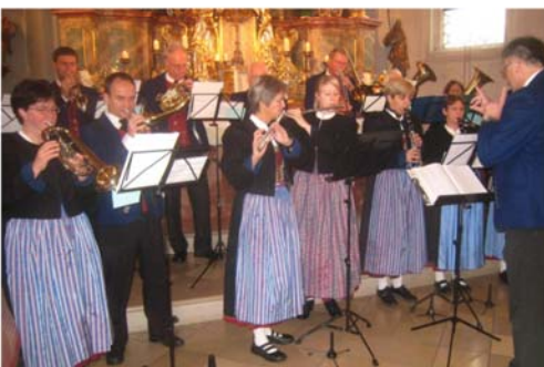
2009 - Vereinsmesse